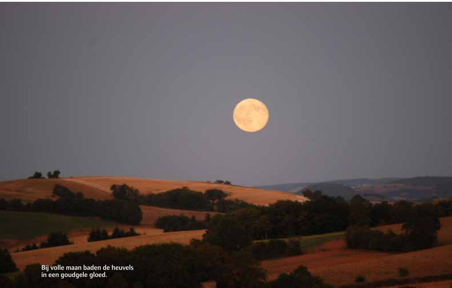
Bij volle maan baden de heuvels in een goudgele gloed.