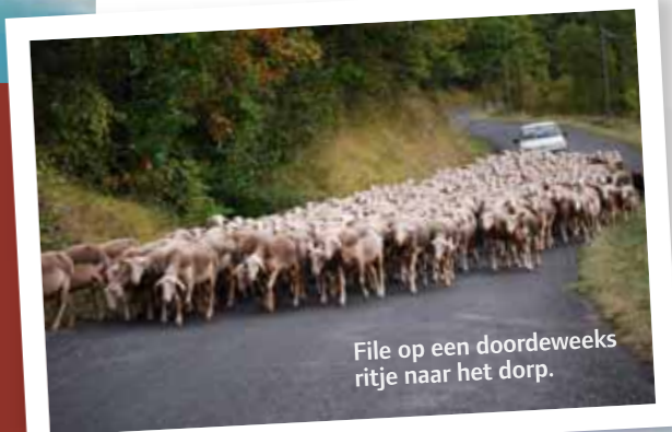
File op een doordeweekse ritje naar het dorp.