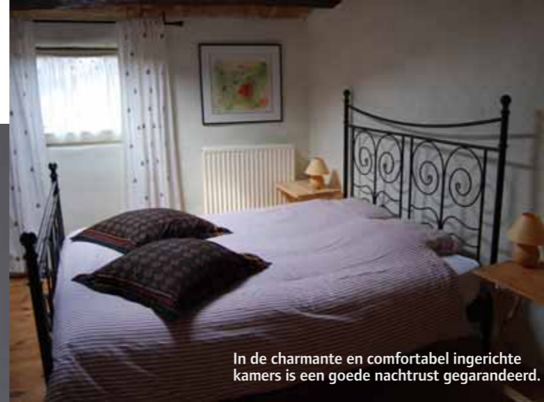
In de charmante en comfortabel ingerichte kamers is een goede nachtrust gegarandeerd.